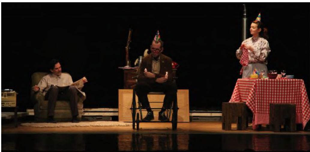
Peepshow dans les Alpes, 2016